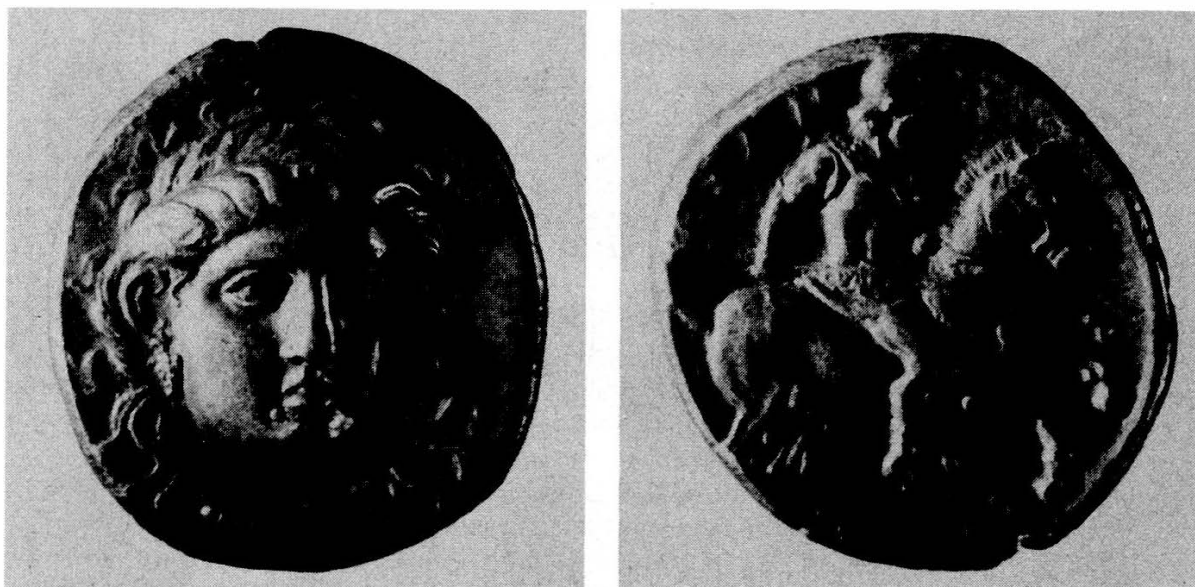
2. Statère d'Alexandre de Phères (368–359). Paris, Cabinet des Médailles (Coll. de Luynes).