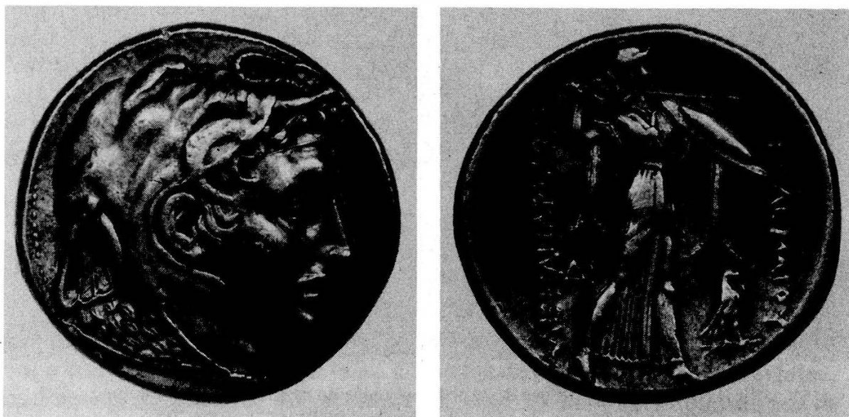
1. Tétradrachme de Ptolémée Ier (vers 314). Paris, Cabinet des Médailles de la Bibliothèque Nationale.